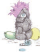
Brigit Helwig-Zeltner 7. April