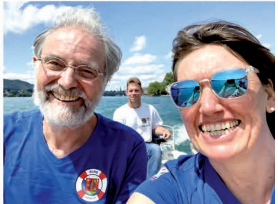
Nun müssen noch die Boote versorgt werden.