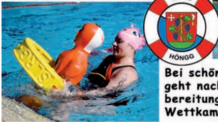
Bei schönstem Wetter geht nach langer Vorbereitung dieser tolle Wettkampf zu Ende!