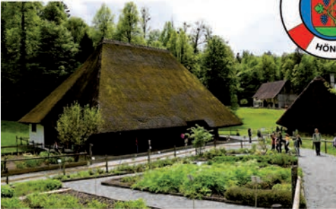
Während die einen am Nachmittag einen Foxtrail absolvieren, streifen die anderen nach Lust und Laune in Grüppchen durch den Ballenberg.