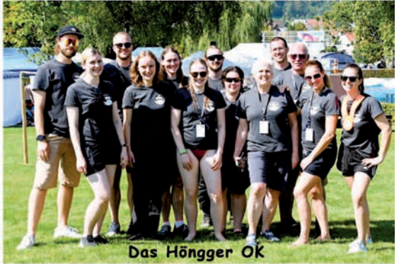
Das Höngger OK