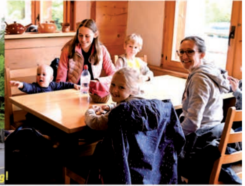
Nach der Ankunft erstmal eine Stärkung!