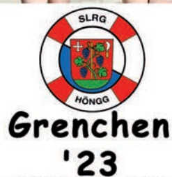
Da freut man sich ab der guten Resultate!